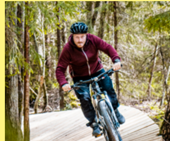
Mountainbike-spåren på Lida byggs om för att spara på naturen och ge roligare cykling.