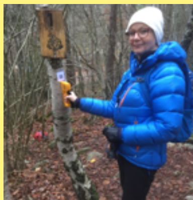
Skogsmullestigen får QR-koder med utmaningar.