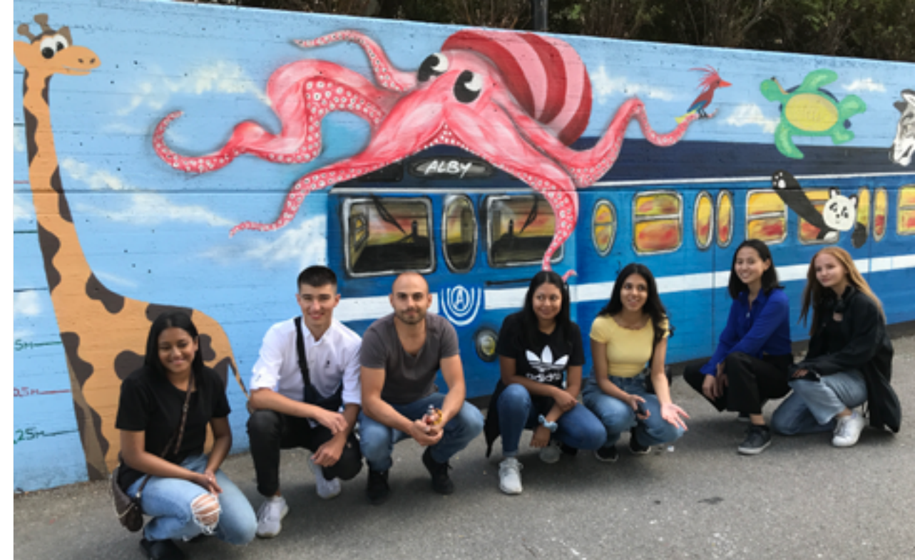
Communityprojekt i Alby centrum med D.I.T., konstnären Aris och Botkyrkabyggen.

Vi har även genomfört flera corona-anpassade samarbetsprojekt, däribland med föreningen Kompani Lomedisco, konstnären Aris T, Ung 16-19, m. fl. Likaså flera samarbeten med bostadsbolag och skolor.