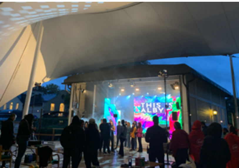
Musikfestivalen This is Alby sändes från Hågelbyparken.

en uppskattad aktivitet att göra på egen hand. Mattekluringbana gjordes i samarbete med Tekniska museet och Botkyrka kommun.