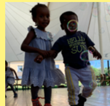
Föreningen Svenska med baby har familjeträffar i Hågelbyparken.