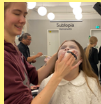
Lovkursen Fear med Subtopia, Cirkus Cirkör och Scenskolan Fejm.