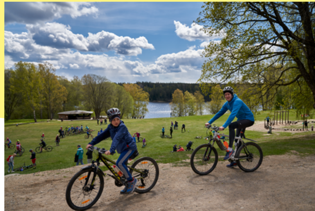
Många besökare till Lida för att motionera, njuta av naturen och umgås på trygga avstånd.

När pandemin kom till Sverige stod vi inför säsongstart med flera stora evenemang planerade och nyöppning av Lida Vårdshus i ny regi. Tillsammans med våra samarbetspartners gjorde vi flera anpassningar och ställde om för att kunna öppna så mycket som möjligt av verksamheten. Det visade sig fungera väl och aldrig förr har så många besökt Lida som under 2020. Detta trots att de stora besöksdrivande evenemangen fick ställas in och året började med en riktigt mild vinter utan snö och is.