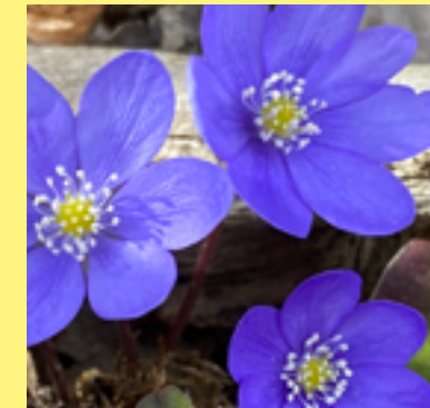
Våren på Lida.