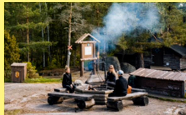
Grillplatsen vid Vildmarksstugan på Lida.