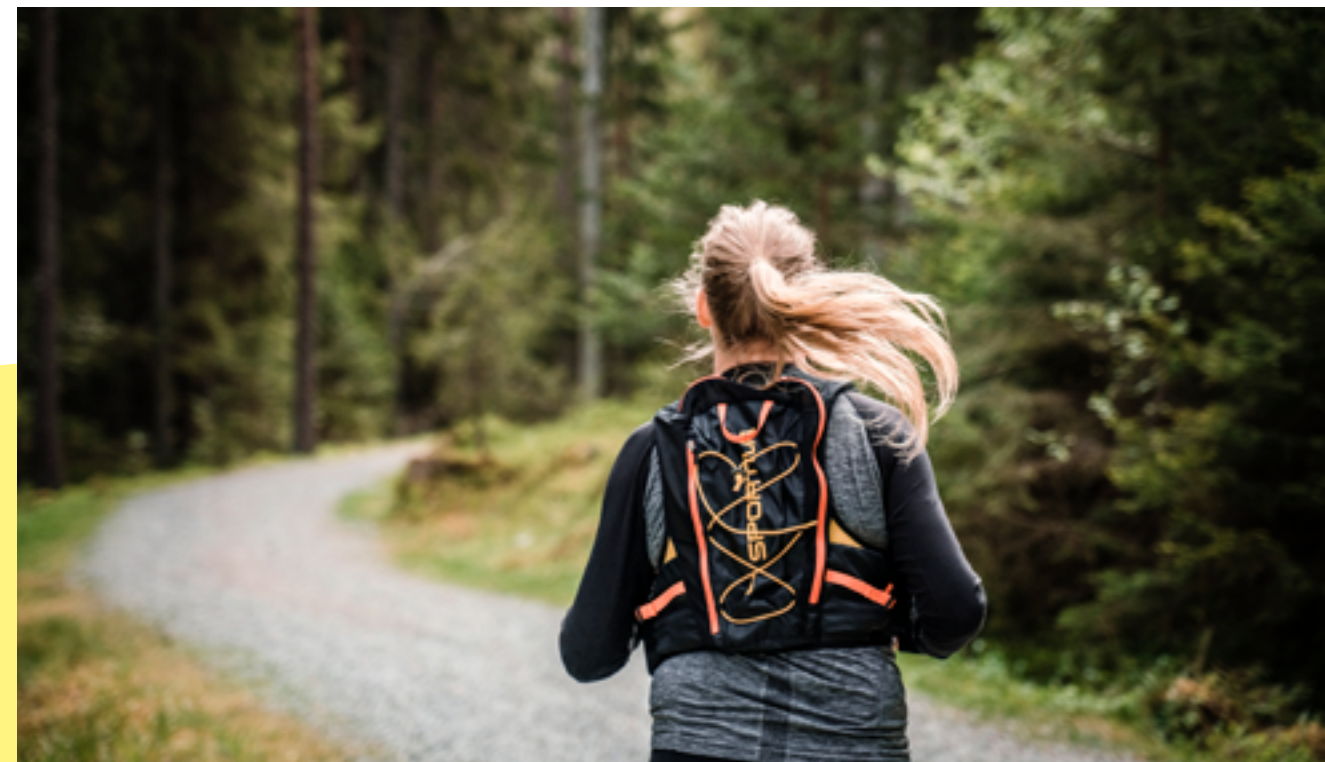
Löpare i motionsspåren Lida-Harbro-Brantbrink.

Under sommarlovet genomförde vi genom finansiering av Botkyrka Kommun Äventyrläger för 48 st. ungdomar. Lägre arrangerades tillsammans med instruktörer från våra samarbetsföreningar på Lida. Under två veckor fick ungdomarna prova på allt från vattenskidor, höghöjdsbana, mountainbikecykling till att laga mat på stormkök. Dessutom arrangerade vi öppna klättringar i Accropark Höghöjdsbana för 100 ungdomar från kommunens föreningar i augusti. Två mycket uppskattade arrangemang för kommunens ungdomar en sommar när många semesterresor och aktiviteter ställdes in på grund av pandemin.