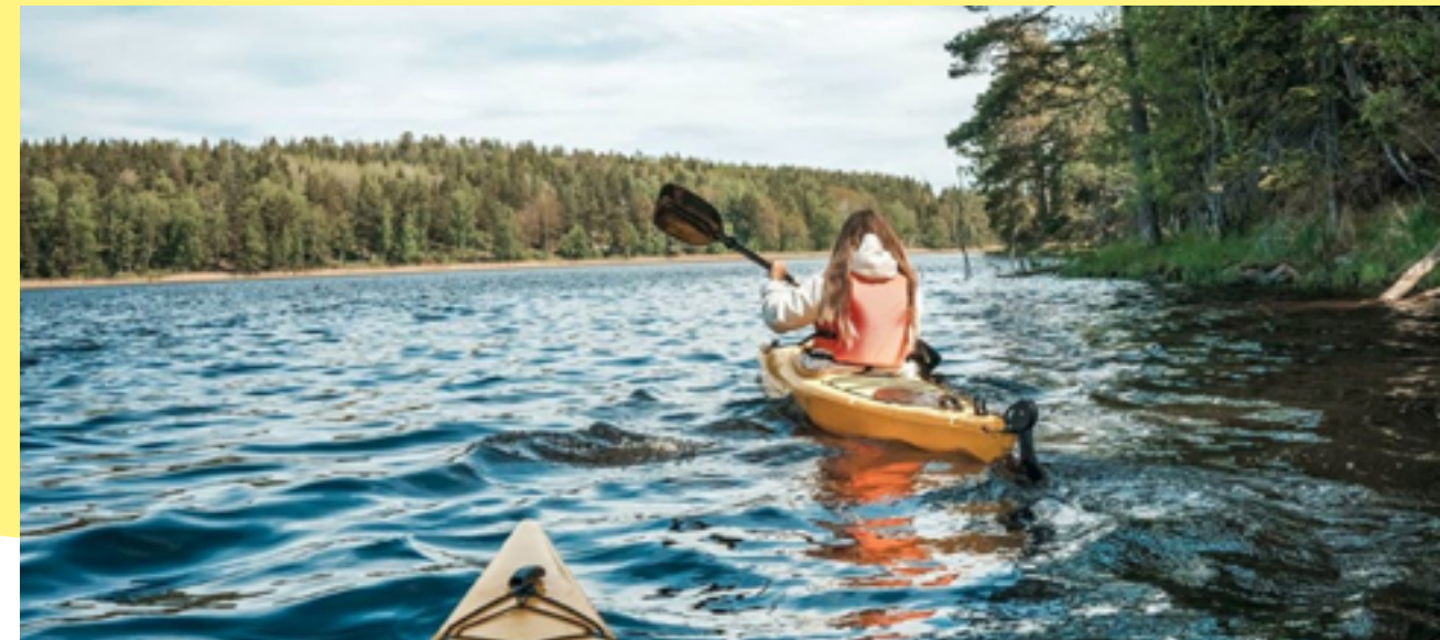
I ett nytt samarbete med outdoorföretaget OutVentures AB startade vi uthyrning av kajaker och mountainbike på Lida i maj 2020.

I skuggan av pandemin avslutades under hösten också samarbetet med restauratören i Hågelbyparken. Förhoppningen är att vi ska kunna starta upp verksamheten under andra kvartalet 2021, detta med hjälp av befintlig restauratör på Lida. På Subtopia stängde restauratören ganska snabbt efter att pandemin slog till och efter sommaren valde man att försätta bolaget i konkurs.