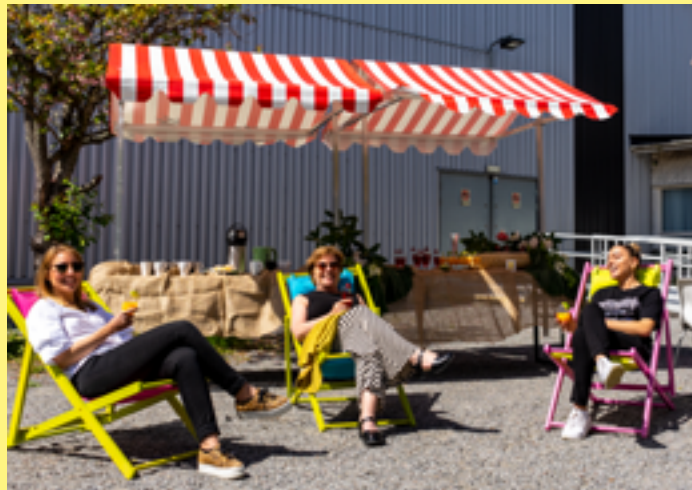
Utomhusmöten på Subtopia.