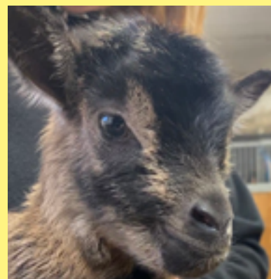
Nyttillskott på Hågelby 4H-gård.