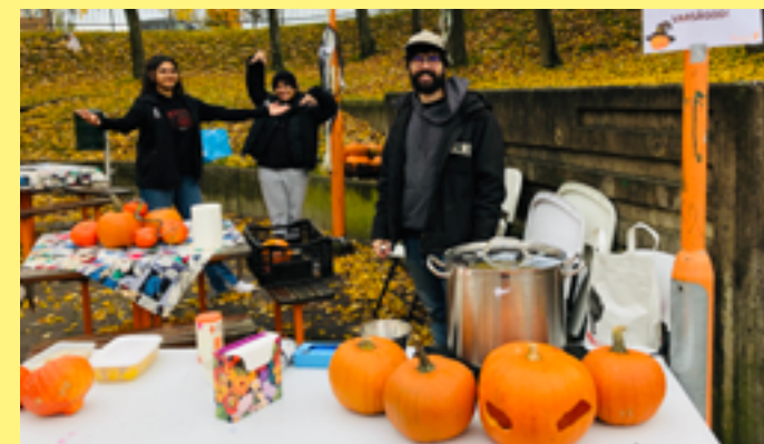
Höstlovsmys i Alby centrum med Subtopia och Boodla i samarbete med Botkyrkabyggen.