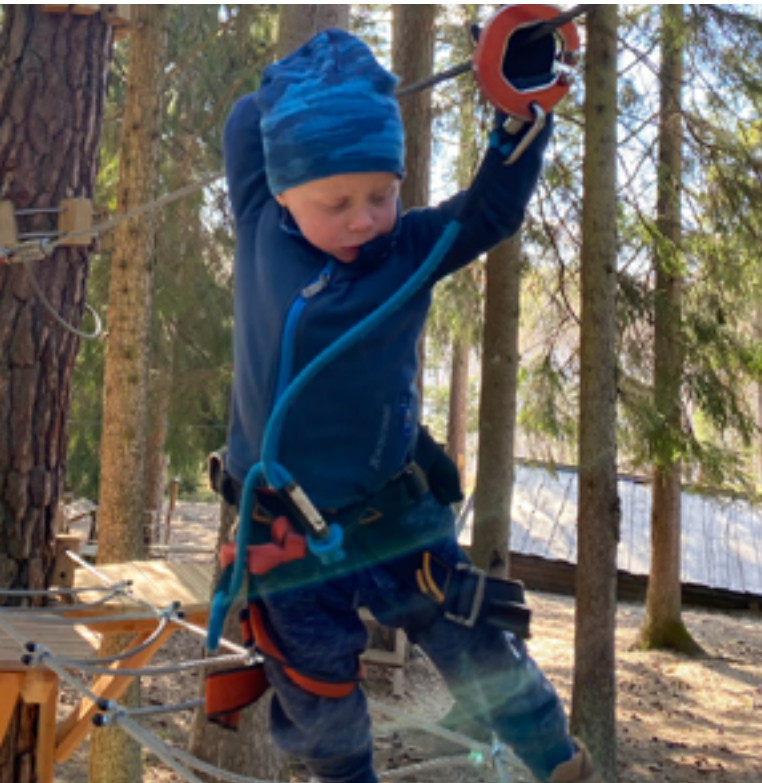
Accropark Höghöjdsbana hade öppet hela säsongen tack vare Covid-anpassningar och onlinebokning.