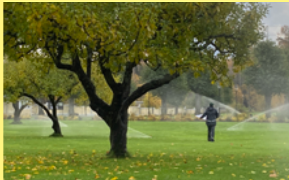
Nytt bevattningssystem i Hågelbyparken.