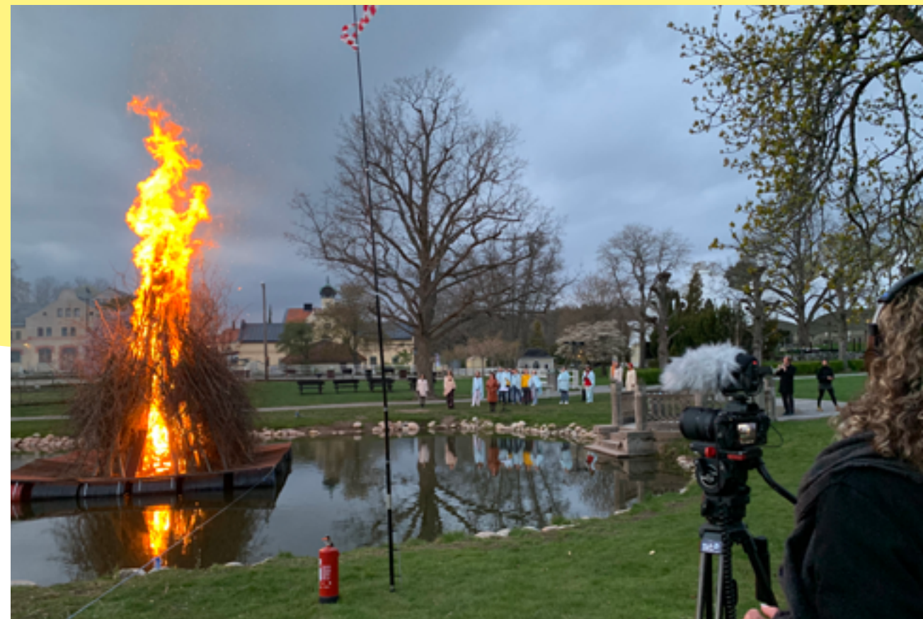
Valborgsfirandet 2020 blev en digital högtid med hjälp av SVT.

Hösten 2020 står äntligen renoveringen av vår ena mur, herrgårdens pelare och trappan till trädgårdsmästarbostaden klar. De har fått en välförtjänt uppräschning och väntas nu kunna stå många år till. Det har även varit ett stort arbete med att planera inför kommande etapp av renoveringen, då ett flertal byggnader i parken ska renoveras.