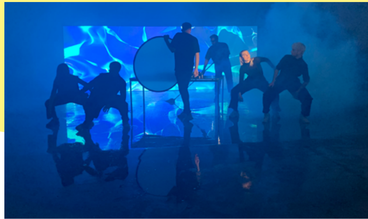
Musikvideoinspelning Studio 3.

Inspelning av dansfilm i Studio 3 med dansskolan Diambra.